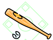
夏の高校野球大会開会式 昭和39年 62016